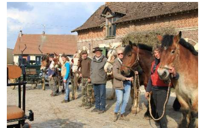
Stage à la semaine 2018

Rien de tel pour faire une bonne progression dans votre pratique de l'attelage.