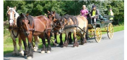
Cours d'attelage à 4 chevaux