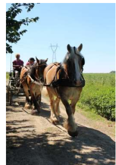
Cours en tandem attelé

Découvrez ce qu'est la conduite d'un attelage