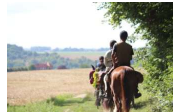
Randonnée de 7 jours à cheval et en attelage.

Stage d'attelage : initiation au tandem attelé. L'équipage le plus technique à conduire !