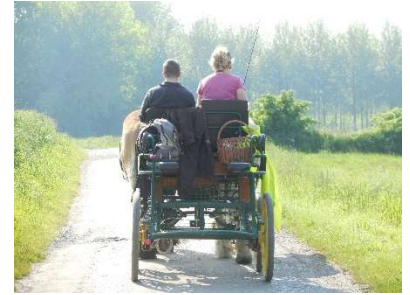
Randonnée à la journée