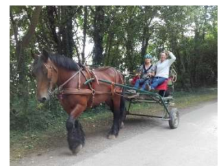
Cours d'attelage en simple de 2h

Ces 5 jours de randonnée itinérante, à cheval ou en attelage, vous y aideront.