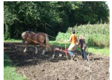
Formation professionnelle en traction animale, ici le maréchage

Comment optimiser la pousse de l'herbe en préparant la prairie à passer l'hiver.