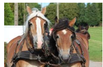
Cours d'attelage en paire

Pour se sentir plus à l'aise en extérieur sur des chemins étroits, abimés, en circulation, et travailler l'agilité de vos chevaux, attelés, aux longues rênes, en main ou en selle.