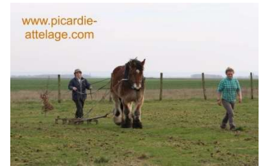
Stage de traction animale

Vous avez des chevaux, et des pâtures mais elles produisent de moins en moins d'herbe de qualité ou entraînent des fourbures. Vous pouvez y remédier. ;)