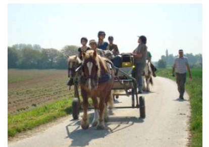
Randonnée de 3 jours, en attelage et à cheval

Pour se sentir plus à l'aise en extérieur sur des chemins étroits, abimés, en circulation, et travailler la maniabilité de vos chevaux, attelés, aux longues rênes, en main ou en selle.